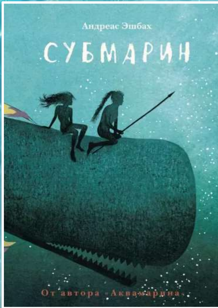
Эшбах А., Субмарин. 12+

Австралия. 2151 год. 15-летняя Саха Лидс решает провести каникулы перед выпускным классом в океанских глубинах. Где-то там живет ее отец - субмарин, человек моря. Именно благодаря его генам она может дышать под водой, а значит, и отправиться в самостоятельное плавание вдоль Зеленого континента. Но оставшаяся на берегу цивилизация не отпускает Саху: над головой проносятся яхты и корабли, то и дело встречаются рыболовные сети, метановые шахты, электростанции, на дне виднеются кабели, трубы - и бесконечный мусор. Более того, руководители некоторых концернов объявляют охоту на подводных жителей. И лишь одно из племен субмаринов не боится дать отпор. Теперь Саха понимает, что она не просто гость в подводном царстве - она Посредница, которая должна объединить людей воды и людей воздуха. Под силу ли героине остановить войну?