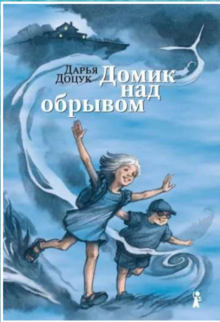
Доцук Д. С., Домик над обрывом: повесть. 6+

Когда ты живешь вдали от городской суеты, практически на краю света, у тебя один день похож на другой, а ход времени подчиняется поразительным и всё же непреложным законам: осень наступает не с первой вечерней прохладой, а с первыми яблочными пирожками, испечёнными тётёй Руфиной. Все события словно расписаны заранее, и никак на них не повлиять - особенно если ты ещё совсем мала.