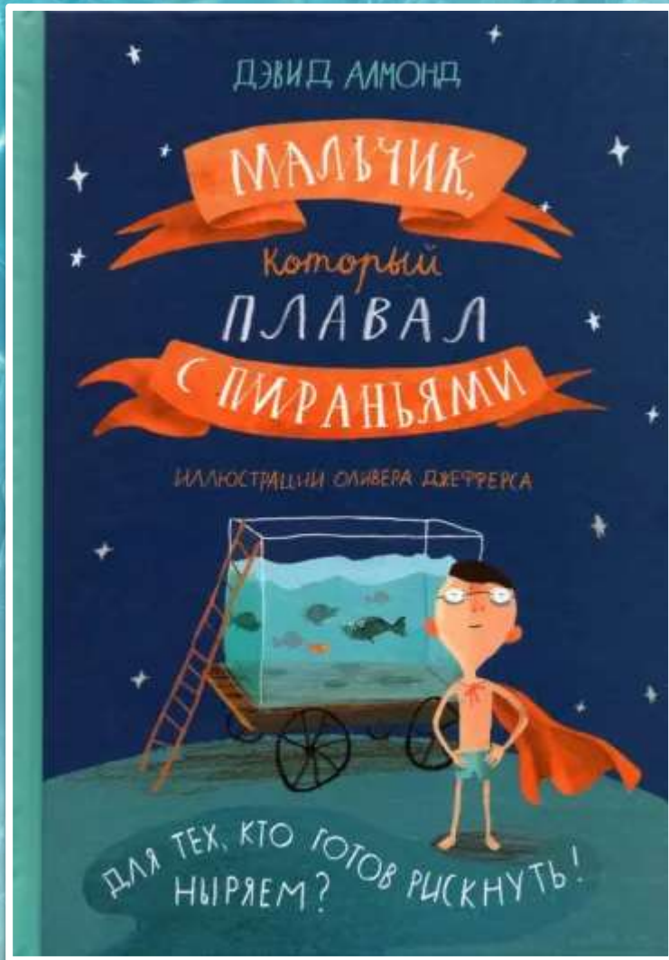
Алмонд Д., Мальчик, который плавал с пираньями: повесть. 6+

Жизнь Стена Эрунда, еще вчера обыкновенного мальчишки, изменилась в одночасье: подъем в 6:00 и - рыба, рыба, рыба... Чисти ее, потроши, закатывай в консервные банки. С утра до ночи. И никаких каникул. Даже побег не спасает от кошмара. Стен попадает на ярмарку, в опасный мир балаганов и магии, и уже готовится нырнуть в аквариум с кровожадными пираньями... Куда ты, одумайся! Они тебя сожрут!