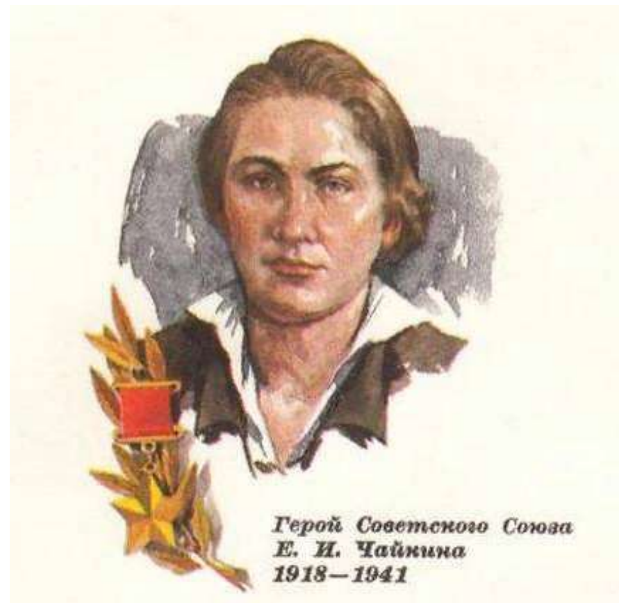
Герой Советского Союза Е. И. Чайкина 1918—1941

Подвиг отважной партизанки воодушевил советское население в тылу и поддержал боевой дух бойцов. 6 марта 1942 Чайкина Елизавета посмертно получила звание Героя Советского союза.