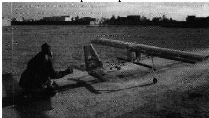
Рис. № 4 - малогабаритный летательный аппарат.

БВС-камикадзе является весьма специфичным классом беспилотной техники, информация о котором чаще всего носит секретный характер. Такой дрон представляет собой малогабаритный летательный аппарат (рис. № 4), способный нести несколько килограмм взрывчатки.