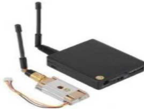
Рис. № 10 -Видеопередатчик.

Видеопередатчик (рис. № 10)- это устройство, передающее на наземную станцию изображение с камер БПЛА. Является самым заметным устройством на борту БПЛА, поэтому без необходимости включать его не стоит (это касается только тех БПЛА, которые хранят фотографии на борту), соблюдая режим радиомолчания. Такой режим уменьшает возможность применения противником средств РЭБ.