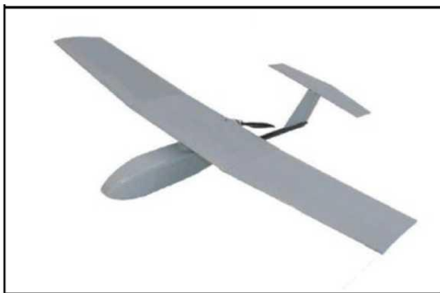
Рис. № 6 – БПЛА самолётного типа.

Существуют БПЛА, предназначенные для выполнения задач РЭР, РЭБ и связи. Скоростной диапазон работы - от 15 до 30 м/с. Рабочие высоты - в зависимости от оборудования и размеров аппарата, но всегда превышают 300 м. Обычно это диапазон высот 300 - 2000 м. Существует несколько аэродинамических схем самолётных БПЛА. Основные аэродинамические схемы – классическая (рис. № 6) и «летающее крыло» (рис. № 7).