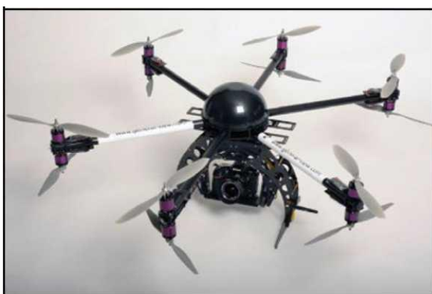
Рис. № 5 - многооторный БПЛА.

Тип БПЛА, который с каждым днем получают все большее распространение, - многооторные системы. Их еще называют мультикоптерами, квадрокоптерами, гексакоптерами, октакоптерами и тому подобное, в зависимости от количества несущих винтов. Характерная особенность - многооторная система, принцип полета - подобен вертолетному (рис. № 5).