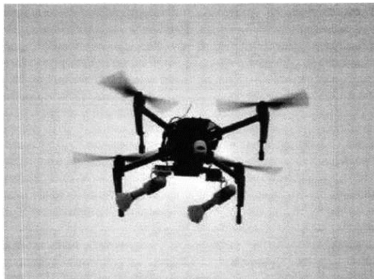
Рис. № 3 – квадрокоптер.

используют отрезок пластиковой трубы, в которой с помощью лески закрепляется граната.