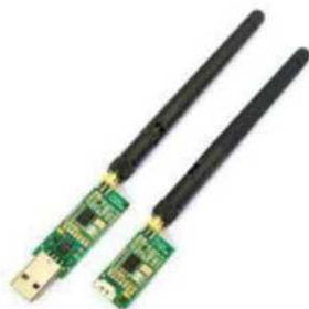
Рис. № 9- Модем телеметрии.

Модем телеметрии (рис. № 9) - приемное устройство, предназначенное для обмена информацией между наземной станцией и БПЛА. От наземной станции он посылает команды к выполнению, от БПЛА - принимает на наземную станцию информацию, получаемую с датчиков (например, скорость, потребление тока, напряжение, положение в пространстве. Обычно является основным каналом управления БПЛА.