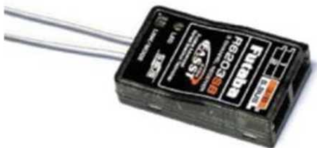
Рис. № 11 -Приемник аппаратуры управления.

Видеопередатчик (рис. № 10)- это устройство, передающее на наземную станцию изображение с камер БПЛА. Является самым заметным устройством на борту БПЛА, поэтому без необходимости включать его не стоит (это касается только тех БПЛА, которые хранят фотографии на борту), соблюдая режим радиомолчания. Такой режим уменьшает возможность применения противником средств РЭБ.