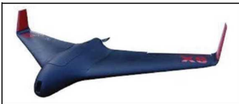
Рис. № 7 – БПЛА тип «летающее крыло».