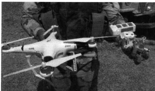
Рис. № 1 - БВС вертолетного типа.

Для совершения диверсионных актов могут использоваться БВС самолетного и вертолетного типа (рис. № 1) кустарного производства, причем доля последних значительно превышает количество самолетных. Объясняется это в первую очередь их более низкой стоимостью.