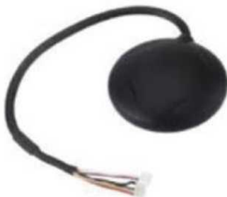
Рис. № 8- Модуль GPS-навигации.

Рассмотрим радиопередающие системы, установленные на БПЛА.